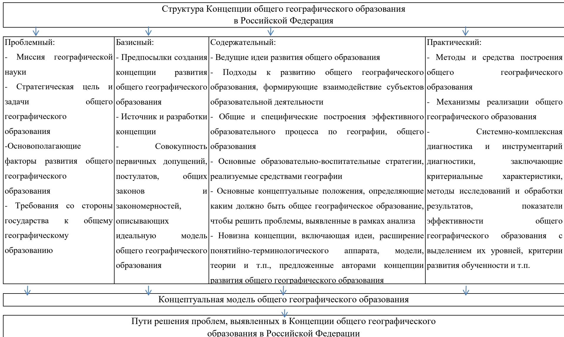
Рис. 1. Основные компоненты концепции общего географического образования (на основе предложенной блок-схемы Н.С. Пурышевой и Р.В. Гуриной [11])